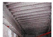
アスベスト含有吹付け ロックウール （鉄骨材の耐火被覆）