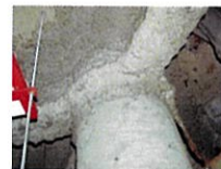
吹付けアスベスト （鉄骨材の耐火被覆）

建築基準法において規制対象とする吹付石綿等が施工されているおそれのある建築物に対しては、地方公共団体が調査および除去等の費用の一部を補助している場合があるので、お近くの地方公共団体にご相談ください。